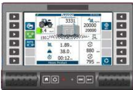
ISO CAN Apollo with ISO BUS ECU

Bruk av marine gradering 80, 16mm kraftige kjeder gir et mer pålitelig gulvdrev. Kjedene er drevet av høyfaste drev, festet til den høyfaste akselen på bakgulvet. Tannhjul festet til frontgulvet skal også sikre perfekt justering og nøyaktig sammenblanding av kjedene.